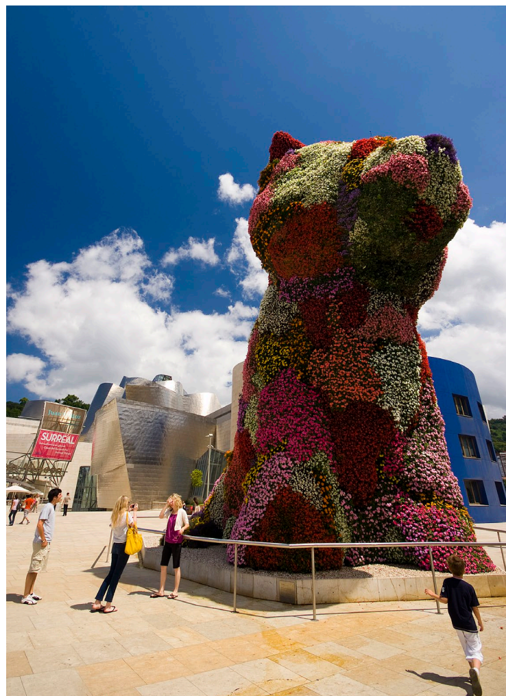
▼ МУЗЕЙ ГУГГЕНХЕЙМА В БИЛЬБАО

11 октября, в день Девы Марии Бегоньи проходит оживленный праздник с концертами, шествиями, мероприятиями для детей, танцами и сельскими видами спорта Страны Басков. От площади Пласа-де-Унамуно начинается лестница с большой историей