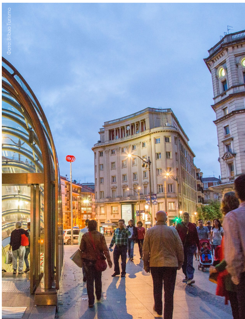
▼ ПЛОЩАДЬ ПЛАСА-СИРКУЛАР

Здесь можно прогуляться по квадратам широких улиц, соединяющимся в таких местах, как площадь Пласа-Сиркулар. Здесь находится монументальное здание Общества Бильбао в эклектичном стиле с изысканной внутренней отделкой в английском стиле. Оно является резиденцией самого элитного и эксклюзивного клуба Бильбао. Продолжив путь по улице Буэнос-Айрес, пересеките реку, чтобы добраться до здания городского совета , фасад которого украшают величественные скульптуры.