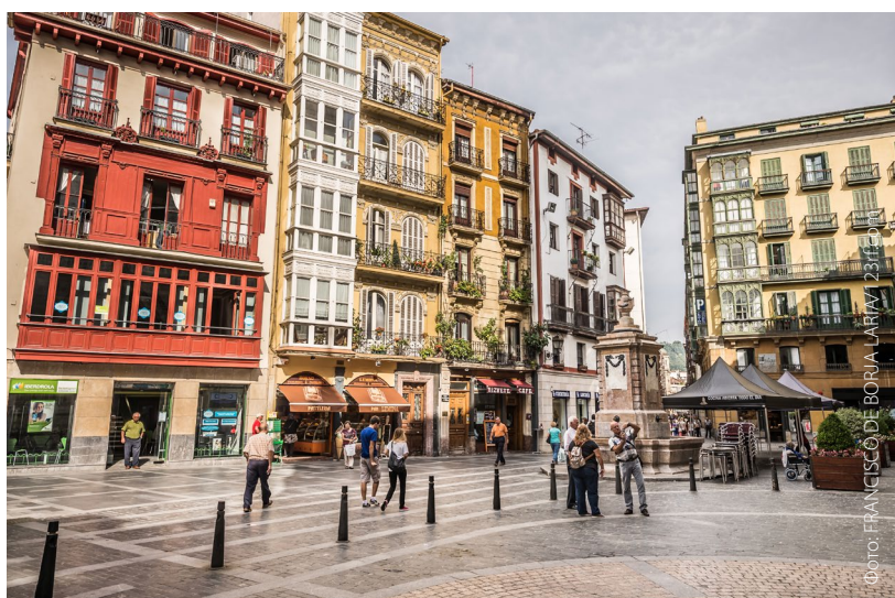
▲ СТАРЫЙ ГОРОД

В районе «Семи улиц» можно обнаружить и другие знаковые места, такие как церковь Сан-Антон , готическое здание XV века (под ее алтарем можно увидеть остатки первоначальной крепостной стены Бильбао) и историческое здание Ла-Больса — дворец XVIII века, превращенный в общественный и культурный центр.