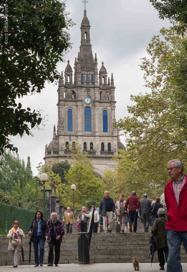
▲ БАЗИЛИКА ПРЕСВЯТОЙ ДЕВЫ БЕГОНЬЯ